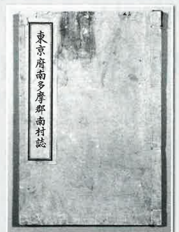
『東京府南多摩郡南村誌』 (小川・細野武文家)