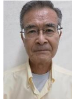
高ヶ坂・成瀬地区

金森親和会は物資の乏しい中、結成され60年になり、運営しながら先輩の苦勞が身に染みる、会員も高齢化が進み新しい人へ勧誘の声を心掛けています。南地区の広報は各地域で古く育まれた伝統と行事、開発を見つけ出し市民の皆さんへお知らせできればと考えています。