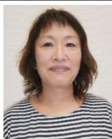
玉川学園・南大谷地区

編集委員を務めて早や5年目になります。これまで連合会の活動を、その都度記事にしてきましたが、今年は新型コロナの影響でほとんどのイベントが中止になり、記事の取材もなく、残念です。連合会として新たな取り組みが示され、実行される状況を連合会だよりで報告していきたいと思っております。