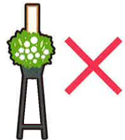
葬式の花輪・供花