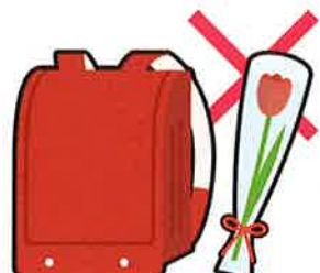
入学祝い・卒業祝い