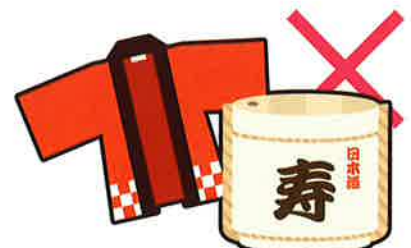
お祭りへの寄附や差し入れ