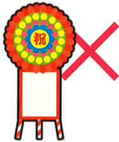
落成式・開店祝いの花輪