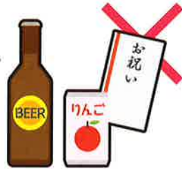
町会の集会や旅行等の 催し物への寄附や 飲食物の差し入れ