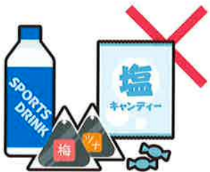
運動会やスポーツ大会への 飲食物の差し入れ