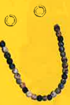
金銅製耳環・石製丸玉