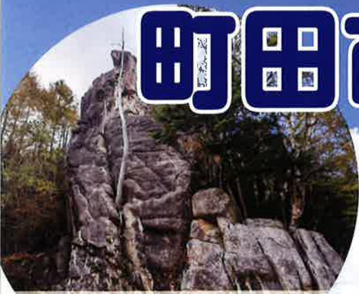
クライミング 小川山・瑞牆山