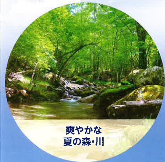
爽やかな 夏の森・川

秩父多摩甲斐国立公園内にあります「星のふるさと」町田市自然休暇村は、標高1,500mで暑さ知らず。周囲は、から松・白樺などの木々に囲まれ、村内には千曲川の支流梓川も流れています。つつじ・しゃくなげなどの咲く春、琥珀色の空の夏、紅葉と静かな星空の秋、雪や霧氷と晴天の多い冬、四季折々の表情で迎えてくれます。