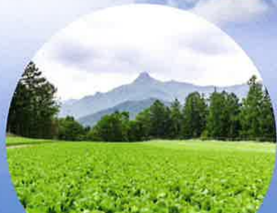
日本一の高原野菜

3～10月／溪流釣り(イワナ、ヤマメ) 5月／川上村山菜まつり 6～11月／登山、ハイキング 7～8月／避暑、川遊び 9～11月／紅葉、きのご狩り 12～3月／スキー&スノーボード