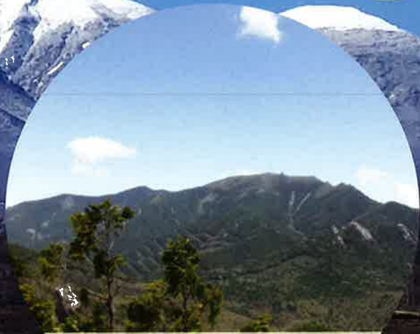
日本百名山 甲武信岳・金峰山 ユネスコエコパーク