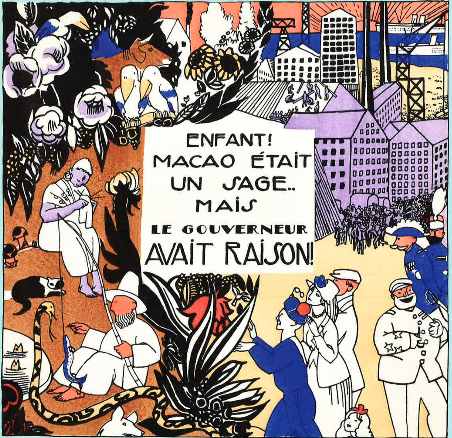
エディールグラン「マカオとコスマージュ」より、1919年刊、ポショワール、当館蔵 © ADAGP, Paris & JASPAR, Tokyo, 2023 G3218