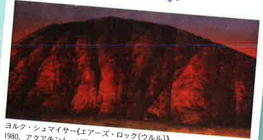
ヨルク・シュマイサー『エアーズ・ロック(ウルル)』1980、アクアチント、ソフトグラント