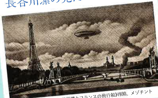
長谷川潔『アレキサンドル三世橋とフランスの飛行船』1930、メゾチント