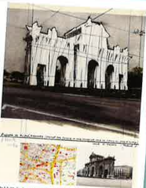
クリストとジャンヌクロード『アルカラ門の梱包、マドリッドのプロジェクト』1981、リトグラフ(多色)、カラーージュ ©ADAGP, Paris & JASPAR, Tokyo, 2023 G3221