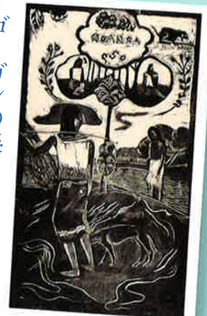
ポール・ゴーガン『ノア・ノア』より、1893-94、木版、当館寄託