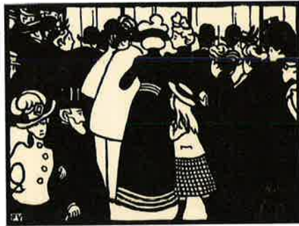
フェリックス・ヴァロットン『万国博覧会』より、1901、木版