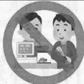
販売・頒布・購入