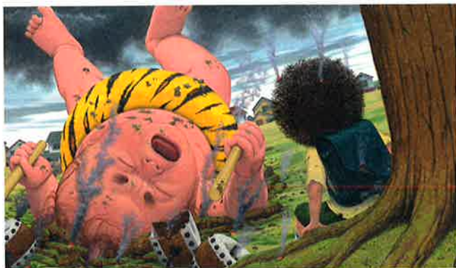
『カミナリこぞうがふってきた』(ポプラ社 2010)