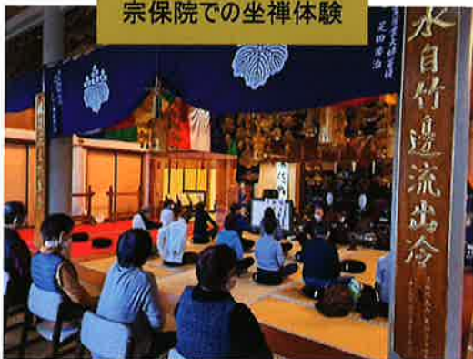
宗保院での坐禅体験

ご住職の講話を聴いた後、約 30 分の坐禅体験。 椅子もあるので、足を組めない方も大丈夫。