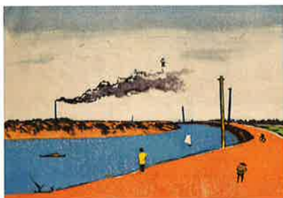
蓬田兵衛門《綾瀬川風景》1932頃 小野忠重版画館蔵