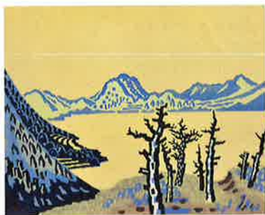
宇治山哲平《小田ノ池》1935 小野忠重版画館蔵