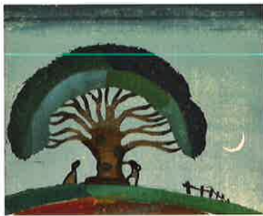
水船六洲《樹》1933 小野忠重版画館蔵