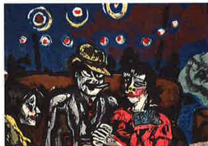
清水正博《酒場》1933 和歌山県立近代美術館蔵