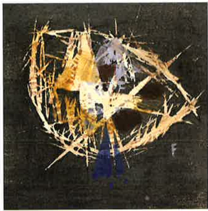
藤牧義夫《つき(『新版画』12号)》1934.4(発行) 神奈川県立近代美術館蔵