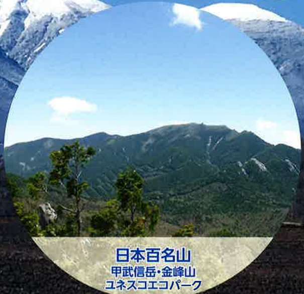
日本百名山 甲武信岳・金峰山 ユネスコエコパーク