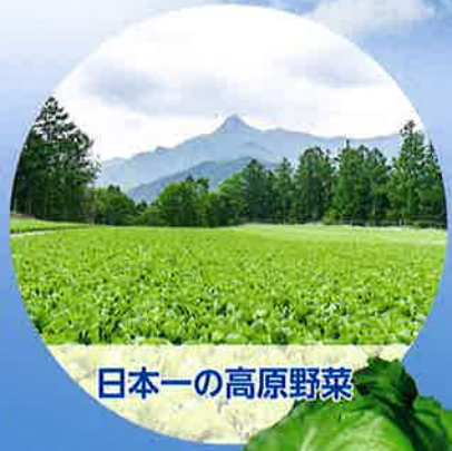
日本一の高原野菜

3~10月/溪流釣り(イワナ、ヤマメ) 5月/川上村山菜まつり 6~11月/登山、ハイキング 7~8月/避暑、川遊び 9~11月/紅葉、きのこ狩り 12~3月/スキー&スノーボード