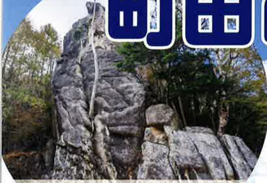
クライミング 小川山・瑞牆山