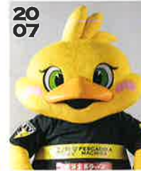
2007 ドーラ DOLA 全カサポーター 2007.09.23