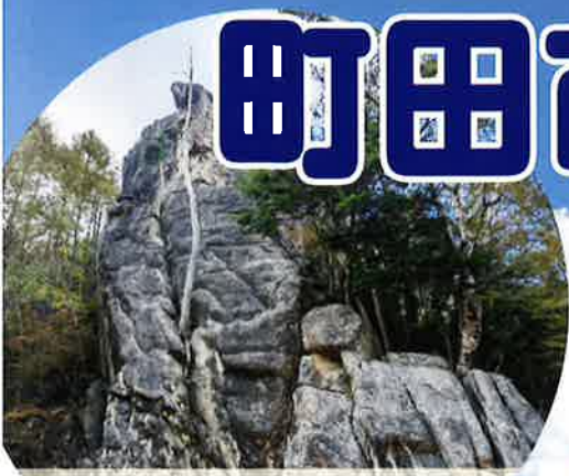
クライミング 小川山・瑞牆山