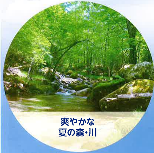
爽やかな 夏の森・川

秩父多摩甲斐国立公園内にあります「星のふるさと」町田市自然休暇村は、標高1,500mで暑さ知らず。周囲は、から松・白樺などの木々に囲まれ、村内には千曲川の支流梓川も流れています。つつじ・しゃくなげなどの咲く春、琥珀色の空の夏、紅葉と静かな星空の秋、雪や霧氷と晴天の多い冬、四季折々の表情で迎えてくれます。