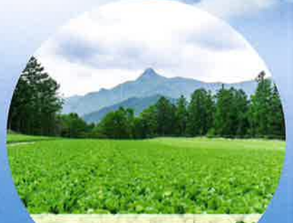
日本一の高原野菜

3~10月/溪流釣り(イワナ、ヤマメ) 5月/川上村山菜まつり 6~11月/登山、ハイキング 7~8月/避暑、川遊び 9~11月/紅葉、きのご狩り 12~3月/スキー&スノーボード