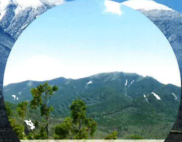
日本百名山 甲武信岳・金峰山 ユネスコエコパーク