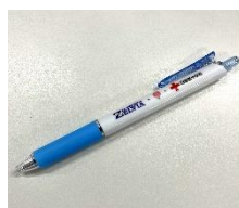
FC町田ゼルビア・日本赤十字社 コラボボールペン

当日、献血にご協力いただいた方へ FC町田ゼルビア・日本赤十字社コラボボールペンをプレゼントします！(※数量限定)