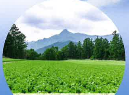
日本一の高原野菜

3~10月/溪流釣り(イワナ、ヤマメ) 5月/川上村山菜まつり 6~11月/登山、ハイキング 7~8月/避暑、川遊び 9~11月/紅葉、きのご祭り 12~3月/スキー&スノーボード