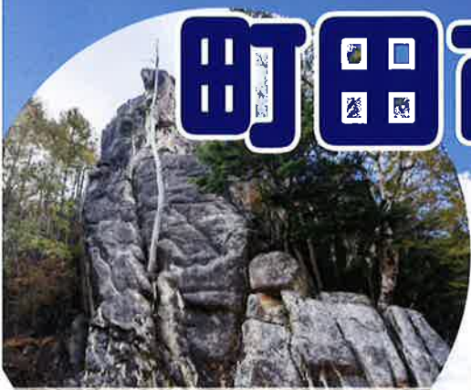
クライミング 小川山・瑞牆山