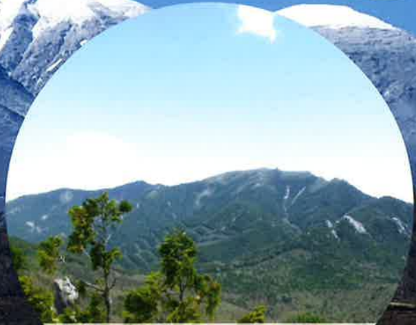
日本百名山 甲武信岳・金峰山 ユネスコエコパーク